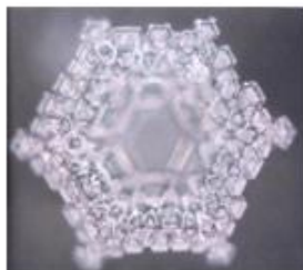
Om Namah Shivaya