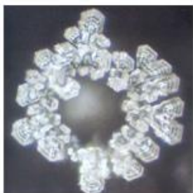
Acqua di Lourdes