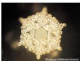
Amore e gratitudine

Grazie alle esperienze del dr. Musaru Emoto, sappiamo che ogni pensiero, parola ecc., può modulare la disposizione delle molecole di H 2 O dell'acqua, dando origine a forme di cristallizzazione speciali.