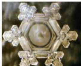
Grazie in Giapponese