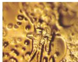
Mi offendi- Ti uccido